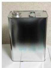
詰め替え用4Lタンク(4Kg入)