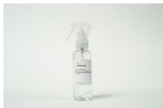
持ち運びに便利な50mlスプレー