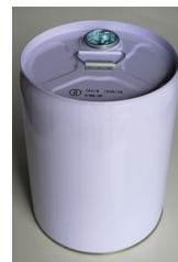
大容量の20Lタンク(20Kg入)